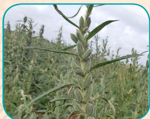
شکل ۱- مقایسه فرم کپسول در رقم شاهد اولتان (سمت راست) و لاین امیدبخش ۵-۹۳ (سمت چپ)